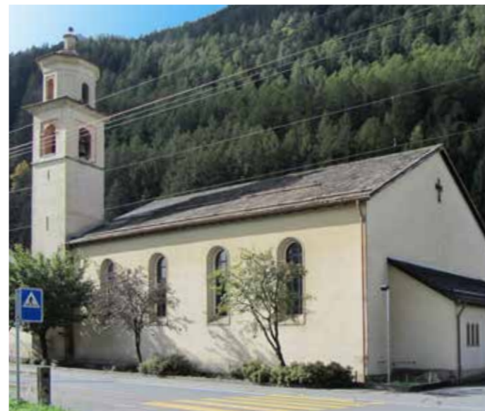
L'église de Le Prese dans le val Poschiavo (GR): entre autres, le clocher nécessite urgemment une rénovation.