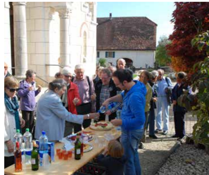
Après la visite de l'église de Bressaucourt (g.) ce fût un grand moment de convivialité lors de l'apéro (d.) offert par la paroisse.