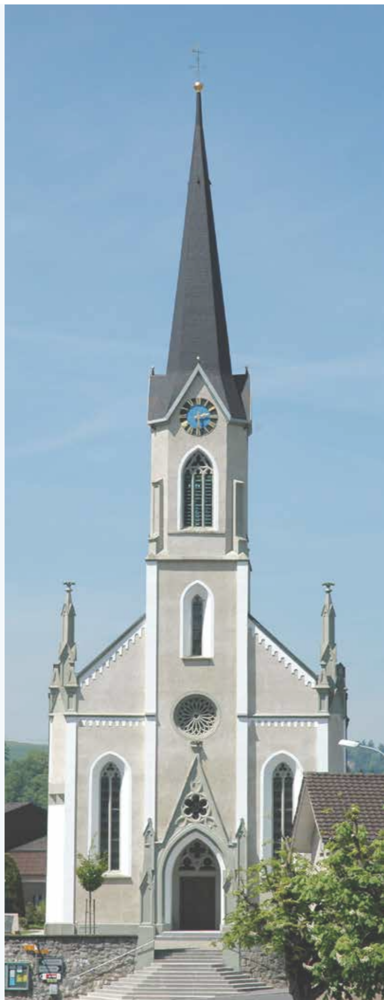
Photo à droite: l'église de Doppleschwand (LU), soutenue par la Mission Intérieure.

SCHWEIZER BISCHOFSKONFERENZ CONFÉRENCE DES ÉVÊQUES SUISSES CONFERENZA DEI VESCOVI SVIZZERI CONFERENZA DILS UESTGS SVIZZERS