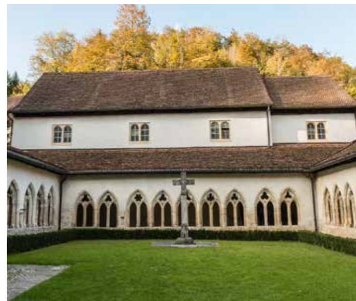
La collégiale Saint-Ursanne (g.) et l'église de Porrentruy (dr.) dans le Jura: deux parmi les trois destinations de l'excursion culturelle de cette année.