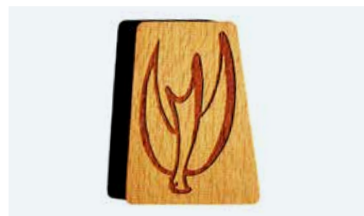
Le nouveau compagnon de chemin de la collection MI: façonné par Sœur Ruth du couvent d'Eschenbach (LU).

Pour les commandes: 041 710 15 01 ou info@solidarite-mi.ch.