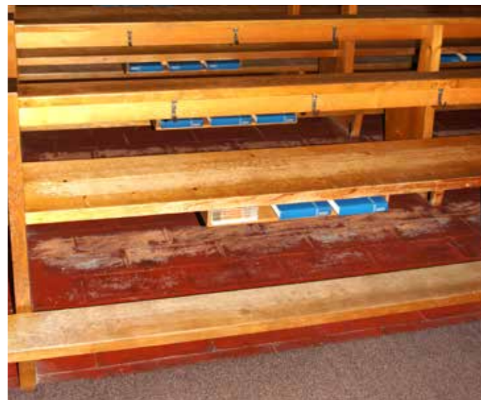
Pas seulement les bancs de l'église abbatiale de Mels sont dans un état déplorable. Tout le bâtiment doit être assaini d'urgence.