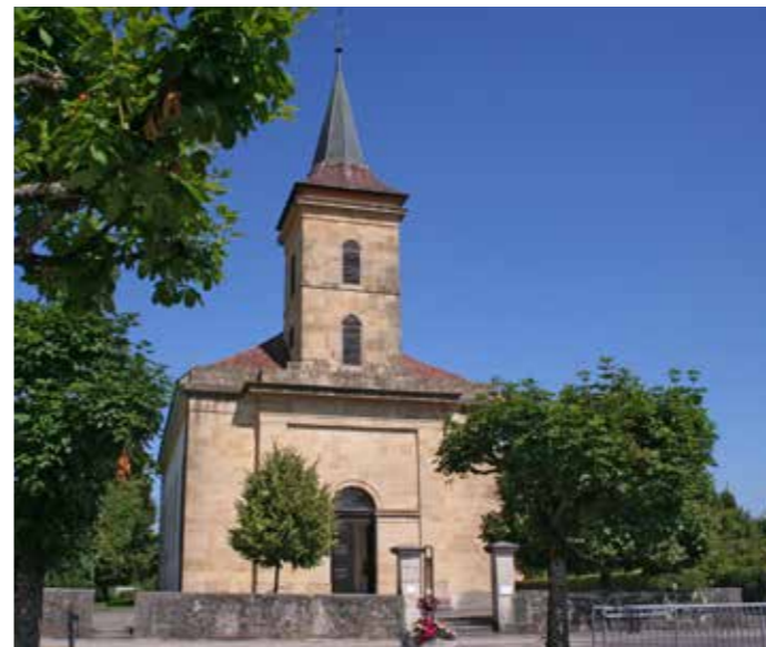
La tradition est encore vivante dans l'église (g.) du Landeron (NE): jeunes et moins jeunes participent au procession surtout lors de la Fête-Dieu (dr.).

Auteur: Frère Ephrem Bucher, gardien du couvent