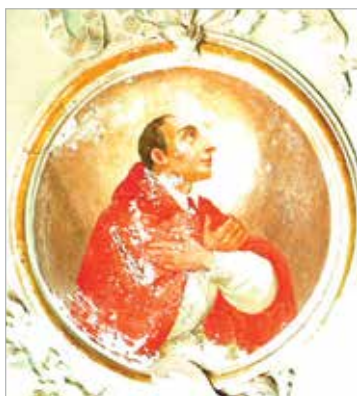
Les fresques se dégradent!

Malgré ce jalon important, il reste beaucoup à faire! Alors que l'intérieur restauré correspond de nouveau à son apparence d'origine du XVI e siècle, les années ont visiblement laissé leurs traces sur la façade extérieure. Les intempéries des dernières décennies ont de plus en plus abîmé l'église – notamment les stucs exposés. L'église en tant que lieu de pastorale vivante est menacée. Si l'on n'intervient pas d'ici peu, nous devons suspendre la messe. Dû au manque de fonds, nous étions forcés de repousser le projet de restauration mi-2011 et d'arrêter les travaux en cours. Les chapelles latérales où se trouvent les fonts baptismaux et la table de communion sont très endommagées et nécessitent également d'être rénovées.