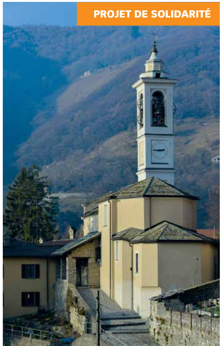
La rénovation de l'église paroissiale de Bruzella est urgente!

Malgré les efforts des dernières années, nous n'avons toujours pas atteint notre objectif. Nous aimerions continuer à fournir ces efforts. Mais nous n'y arri-