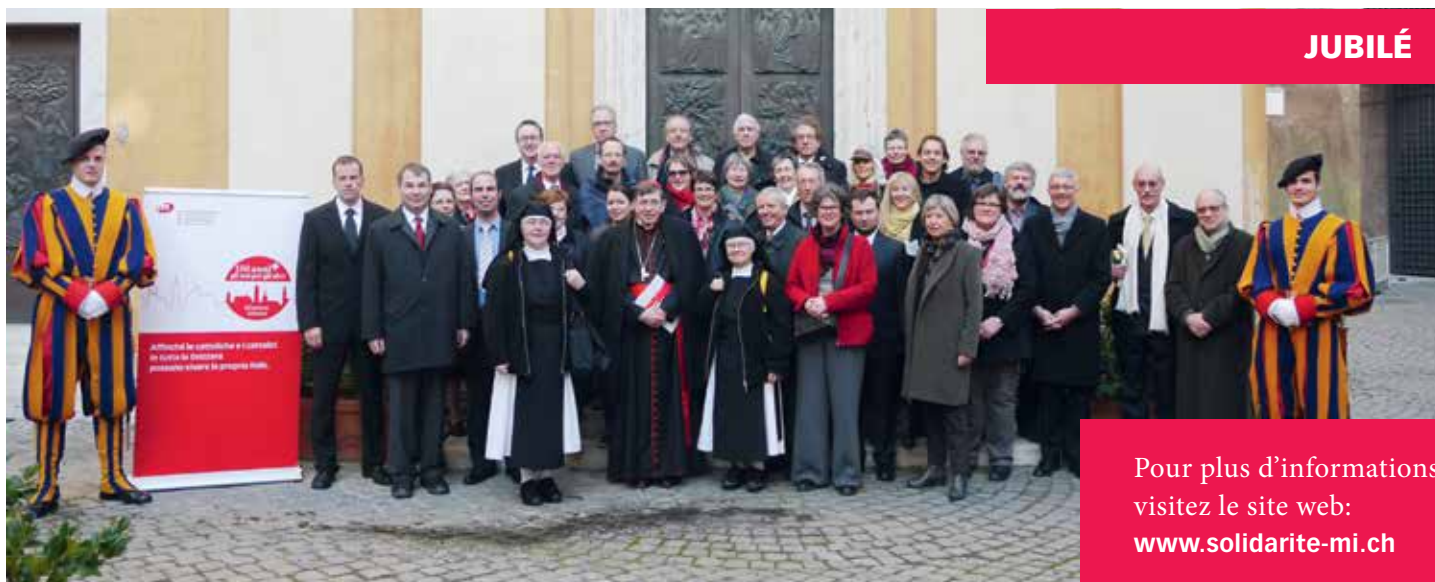
Le groupe d'excursion de la Mission Intérieure à Rome avec le cardinal Kurt Koch.

Pour plus d'informations, visitez le site web: www.solidarite-mi.ch