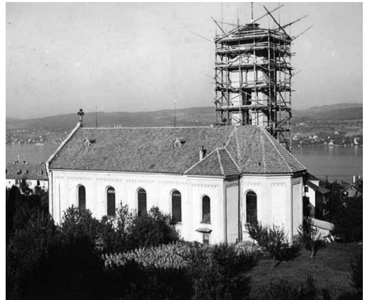
La paroisse de Thalwil dans le canton de Zurich: une paroisse typique de la diaspora.